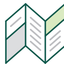
チラシ リーフレット